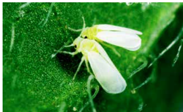
Mosca Blanca ( Bemisia tabaci )