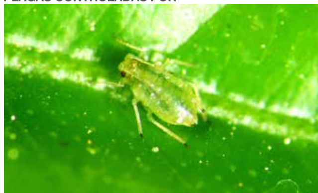
Pulgón ( Myzus persicae )